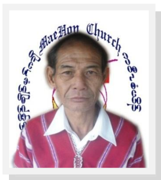
ศาสนจารย์ตะโตะแประ